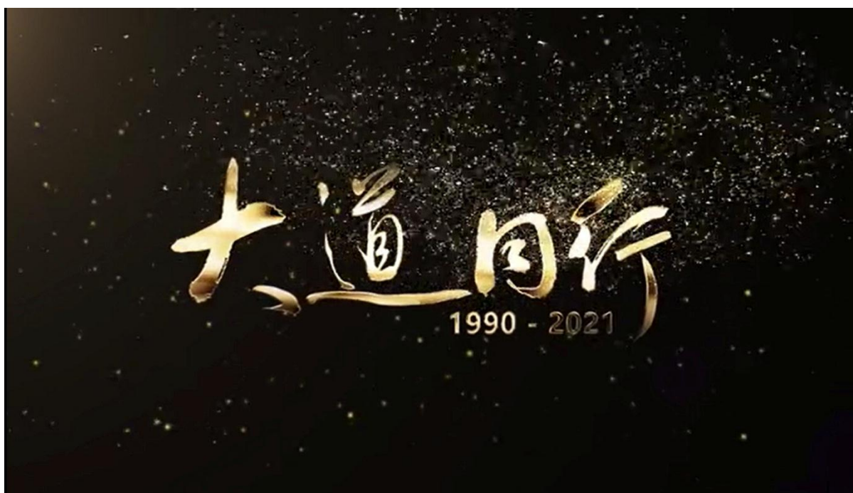
记载中国医学教育技术 30 年发展印记的视频片《大道同行》