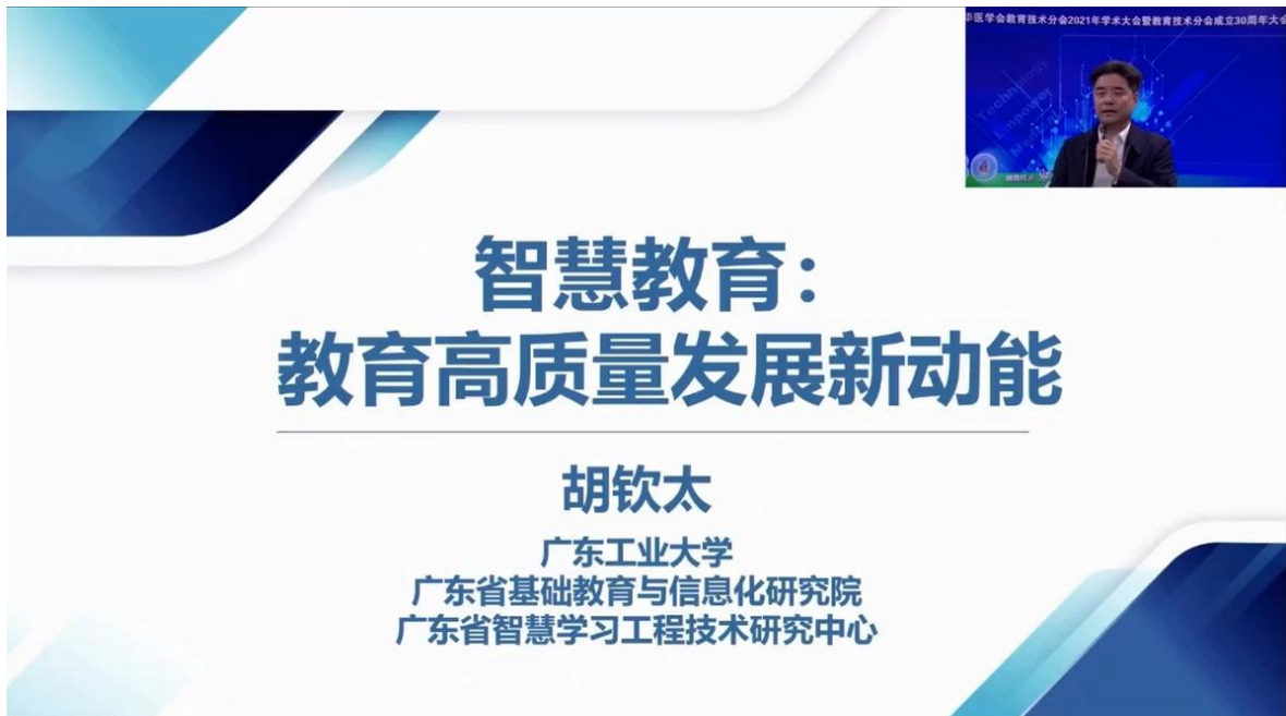
广东工业大学书记胡钦太教授作报告